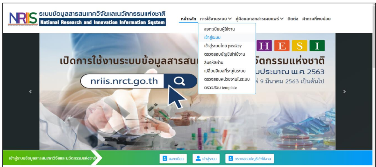
รูปที่ 1 หน้าเข้าสู่ระบบ